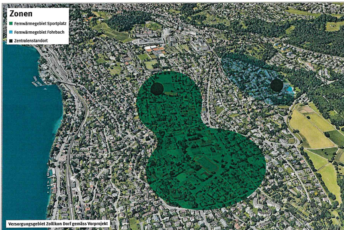
Versorgungsgebiet Zollikon Dorf gemäss Vorprojekt

Das Vorprojekt zeigt auf, dass das Projekt mit einem zu Gas und Öl vergleichbaren Energiepreis realisiert werden kann. Vor allem für grössere Liegenschaften, bei welchen ein Heizungsersatz mit erneuerbaren Energien nicht einfach zu realisieren ist, lohnt sich ein Anschluss an den Wärmeverbund.