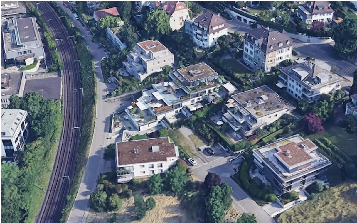
Abschreckend: Architektonische Verdränger-Typen in Zollikon